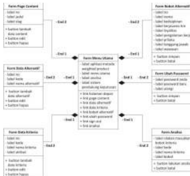
Gambar 4. Class Diagram