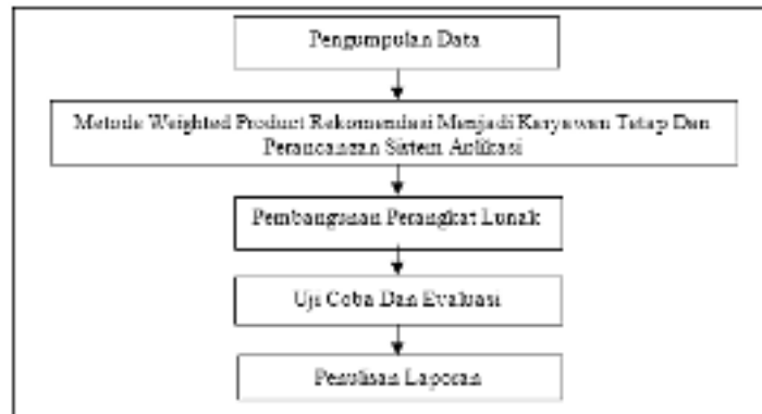
Gambar 1. Waterfall Model

Gambar kotak dengan garis putus-putus yang terlihat dalam Gambar 2 merupakan sistem yang akan dibahas dalam penelitian ini. Dalam hal ini seleksi kriteria untuk penyeleksian data karyawan kontrak untuk direkomendasikan kepada HRD adalah sebagai berikut :