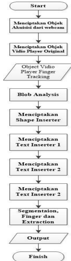
Gambar 2. Flowchart