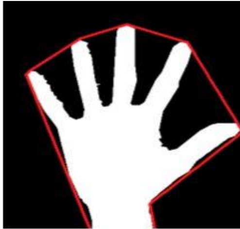
Gambar 1. Convex hull enclosing the hand region