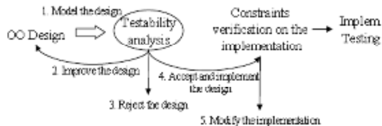
Gambar 1. Metodologi Pengujian Kualitas Desain Berorientasi Objek