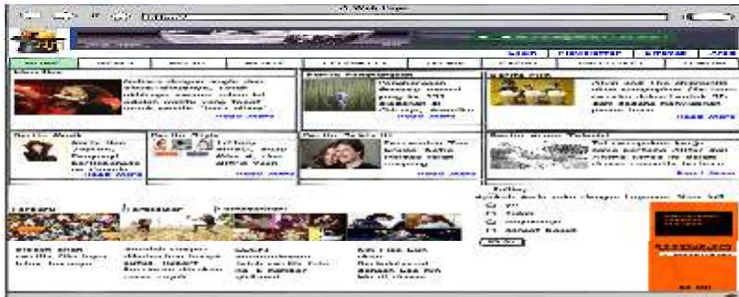
Gambar 4.1. Halaman Front End