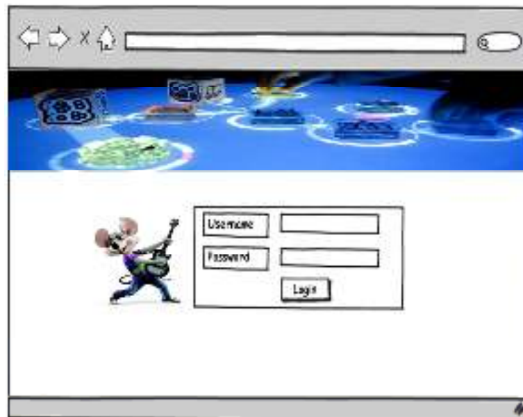
Gambar 4.2. Halaman Back End