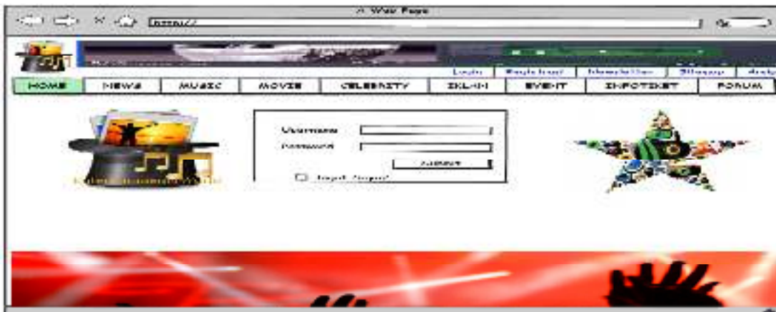
Gambar 3.2 Halaman Login User