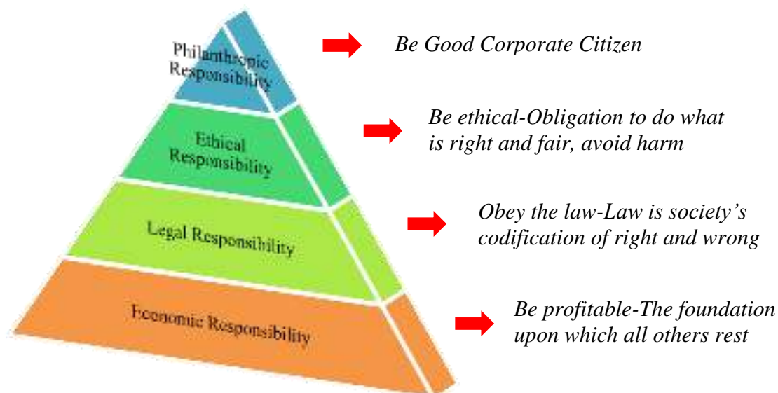
Gambar 1. Piramida Corporate Social Responsibility Carroll Sumber : Archie B. Carroll, 1991

Berikut adalah piramida CSR yang dikembangkan oleh Archie B. Carroll di tahun 1991, sebagaimana tampak di bawah ini :