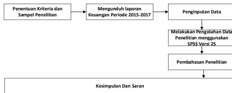
Gambar 2 Langkah-langkah Penyelesaian Masalah

Berikut Gambar 2 mengenai langkah-langkah penyelesaian masalah penelitian: